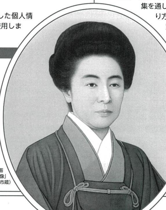
原田芳洲画 「下田歌子先生肖像」 (岐阜県恵那市蔵)